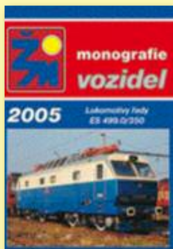
Křídový papír, barevný tisk, 220 stran, lamino, vazba V8.