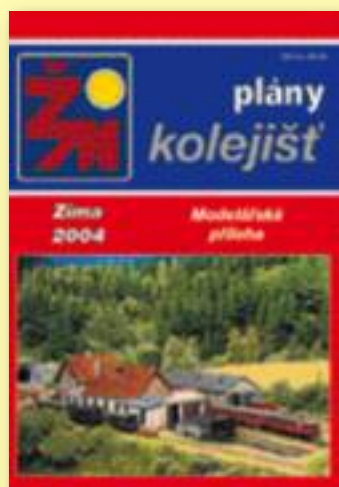
Křídový papír, barevný tisk, 100 stran, lamino, vazba V2.