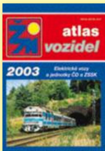
Křídový papír, barevný tisk, 240 stran, lamino, vazba V8.