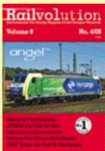
Křídový papír, pauzovací papír, plakát B2, barevný tisk, 80 stran, vazba V1.