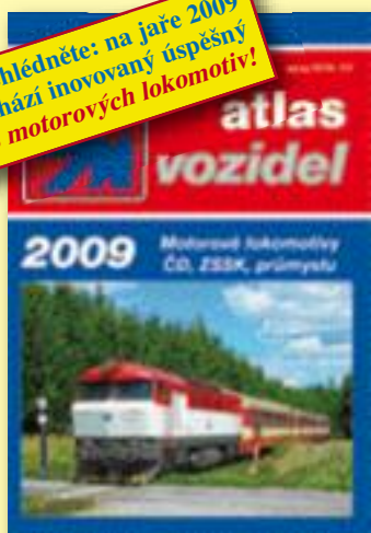
Křídový papír, barevný tisk, 240 stran, lamino, vazba V8.

Nepřehlédněte: na jaře 2009 vychází inovovaný úspěšný Atlas motorových lokomotiv!