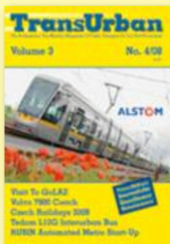
Křídový papír, pauzovací papír, plakát B2, barevný tisk, 36 stran, vazba V1.