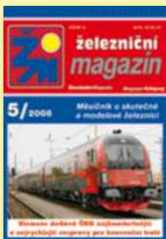
Křídový papír, barevný tisk, 48 stran, vazba V1.