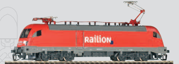
47412 E-Lok BR 182 „Railion“ Ep. V 67,99 €*