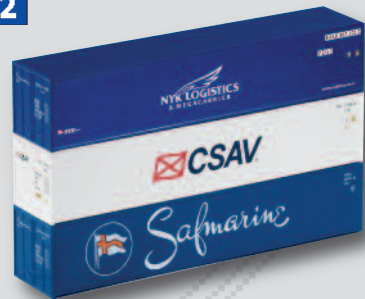
46100 3er Set 40' Container 9,99 €*