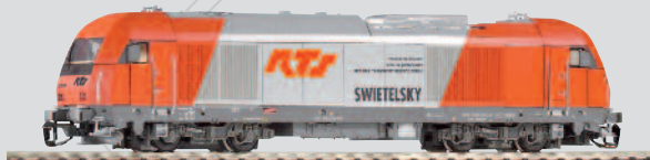
47586 Diesellok Herkules 2016 905 „RTS“ Ep. V 64,99 €*