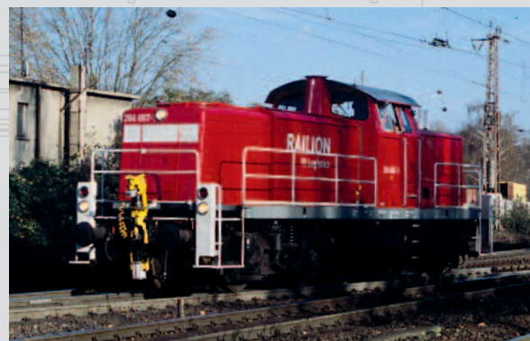
47261 Diesellok 291 Railion Logistic Ep. VI