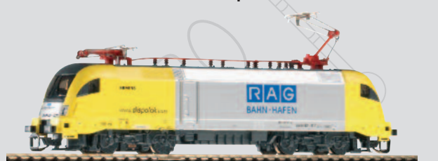
47418 E-Lok Taurus ES 64 U2-017 „RAG-Ruhrkohle AG“ Ep. V 67,99 €*