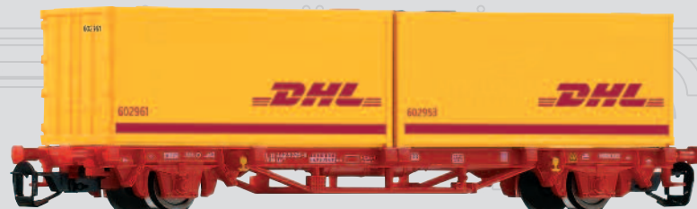
47709 Containertraggwagen Lgs579 „DHL“ DB AG Ep. VI 20,99 €*