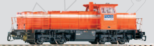
47221 Diesellok G 1206 RAG Ep. V