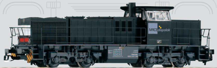
47223 Diesellok G 1206 MRCE Ep. VI