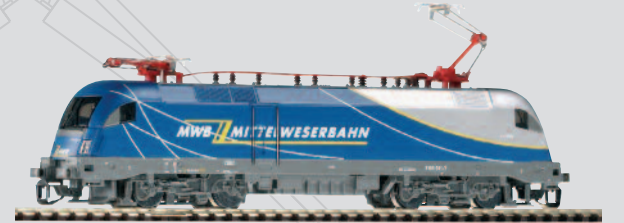
47415 E-Lok Taurus „MWB - Mittelweserbahn“ Ep. V 67,99 €*