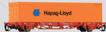
47702 Containertraggwagen Lgs579 „Hapag-Lloyd“ DB Cargo Ep. V 19,99 €*