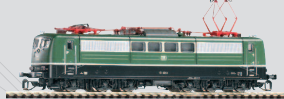
47201 E-Lok BR 151 DB Ep. IV mit Scheren-Stromabnehmer 69,99 €*