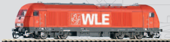
47590 Diesellok Herkules „Westfälische Landes-Eisenbahn GmbH“ Ep. V 64,99 €*