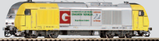
47587 Diesellok Herkules ER20-007 „Stahl aus Thüringen“ Ep. V 64,99 €*