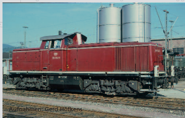
47260 Diesellok 290 DB Ep. IV

Ab 1995 wurden in großer Zahl Lokomotiven der BR 290 mit einer Funkfernsteuerung ausgerüstet. Dies ermöglichte die Einsparung von Rangierpersonal. Die so umgebauten Loks der BR 290 und BR 291 wurden als BR 294 bzw. BR 295 bezeichnet.