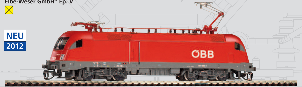
47428 E-Lok Taurus ÖBB“ Ep. V 67,99 €*