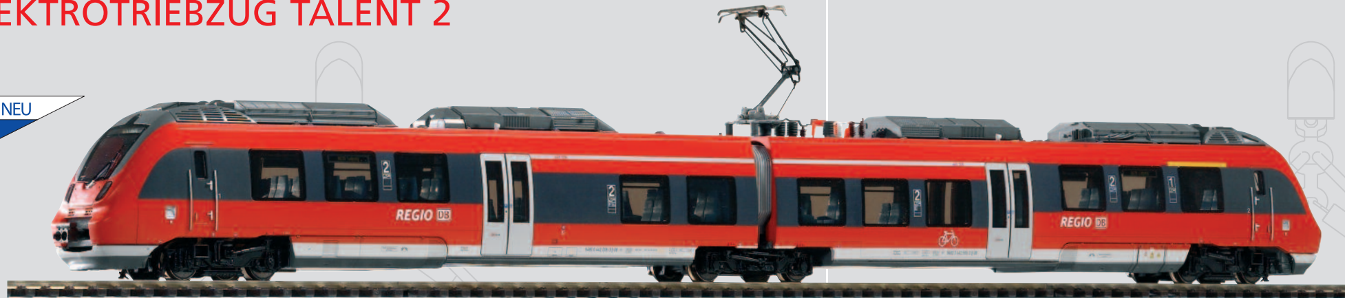
47240 2-tlg. Elektrotriebwagen BR 442 „Talent 2 - Cottbus“ DB AG Ep. VI