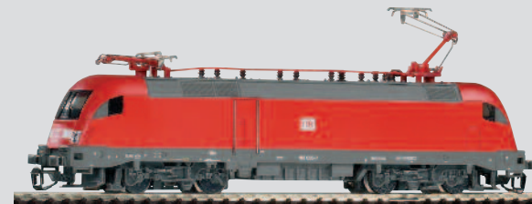
47410 E-Lok BR 182 DB AG Ep. V 67,99 €*