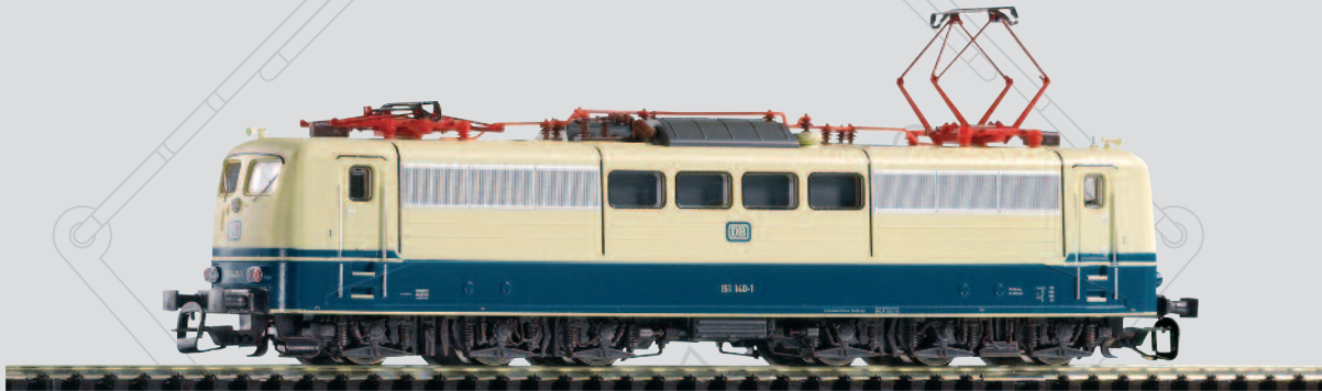
47202 E-Lok BR 151 DB Ep. IV mit Scheren-Stromabnehmer 69,99 €*