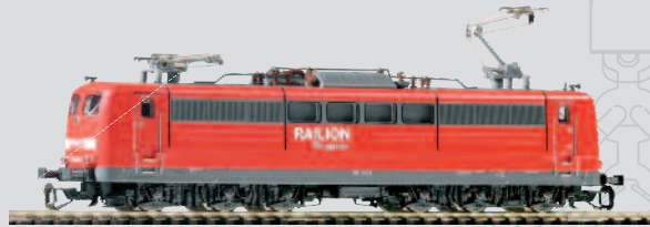
47200 E-Lok BR 151 DB AG Ep. V mit Einholm-Stromabnehmer 69,99 €*