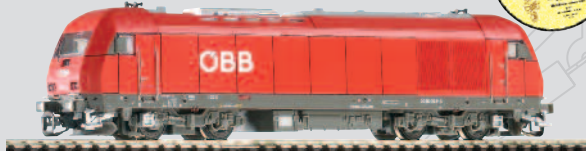
47580 Diesellok Herkules Rh2016 ÖBB Ep. V 64,99 €*