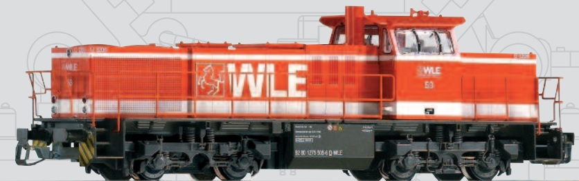
47222 Diesellok G 1206 WLE Ep. VI