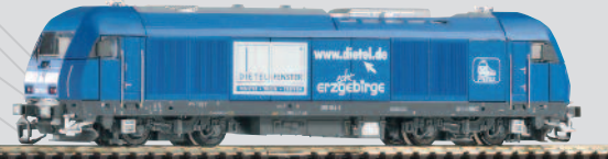
47583 Diesellok Herkules 253 014-9 „Pressnitzalbahn“ Ep. V 64,99 €*