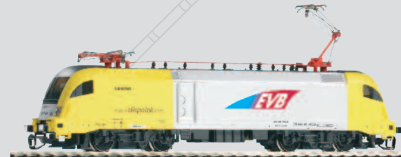
47417 E-Lok Taurus ES 64 U2-038 „EVB-Eisenbahn und Verkehrsbetriebe Elbe-Weser GmbH“ Ep. V 67,99 €*