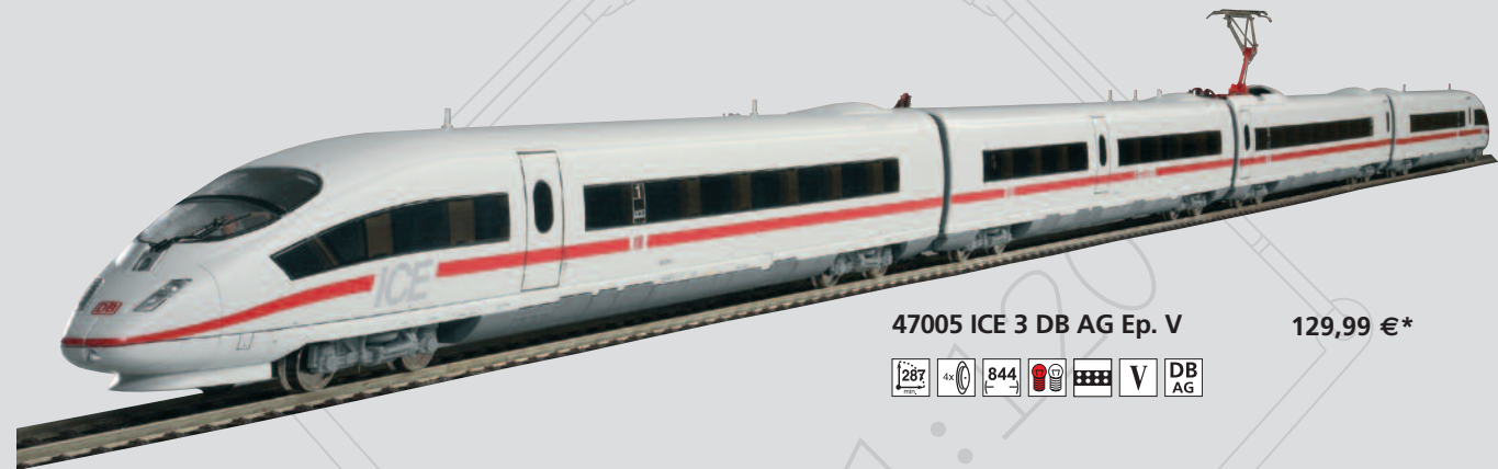
47005 ICE 3 DB AG Ep. V 129,99 €*