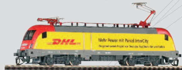
47413 E-Lok BR 182 Railion „DHL“ Ep. V 67,99 €*