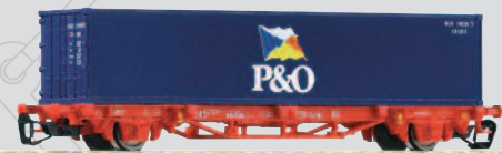
47700 Containertraggwagen Lgs579 „P&O“ DB Cargo Ep. V 19,99 €*