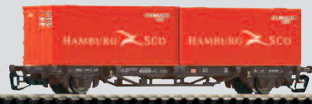
47707 Containertraggwagen Lgs579 „Hamburg Süd“ DB AG Ep. V 19,99 €*