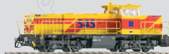
47220 Diesellok G 1206 EH Ep. VI