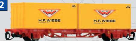
47708 Containertraggwagen Lgs579 „Wiebe“ DB AG Ep. VI 20,99 €*