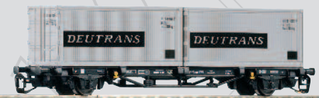
47705 Containertraggwagen Lgs579 „Deutrans“ DR Ep. IV 20,99 €*