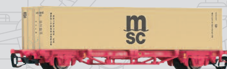
47706 Containertraggwagen Lgs579 „MSC“ NS Ep. VI 19,99 €*