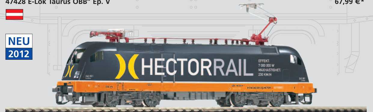
47427 E-Lok Taurus „HECTORRAIL“ Ep. VI 67,99 €*