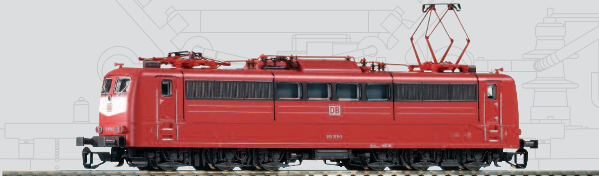
47203 E-Lok BR 151 orientrot mit Latz DB AG V mit Scheren-Stromabnehmer 69,99 €*