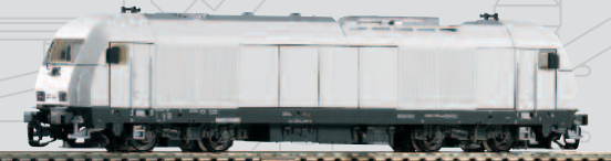
47592 Diesellok Herkules ER20 Siemens Ep. VI 64,99 €*