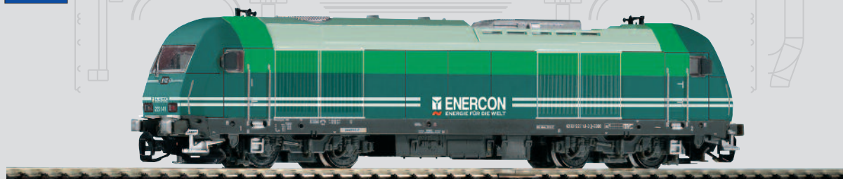
47593 Diesellok Herkules ER20 „Enercon“ Ep. VI 64,99 €*