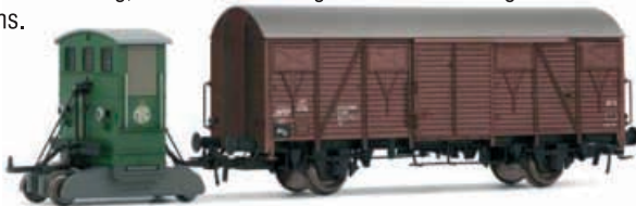
Abbildung zeigt Fotomontage

Breuer Rangiertraktor der Firma „MILAG“, beide Achsen angetrieben, Stirnbeleuchtung, im Set mit einem gedeckten Güterwagen der Bauart Gmhs.