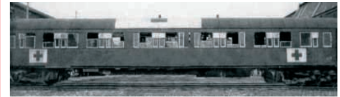
Abbildung zeigt Fotomontage