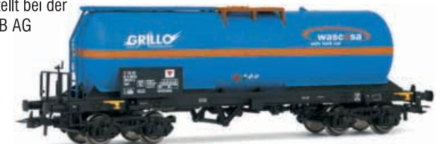
Abbildung zeigt Fotomontage

4-achsiger Kesselwagen, Bauart Zagns der WASCOSA/GRILLO, eingestellt bei der DB AG