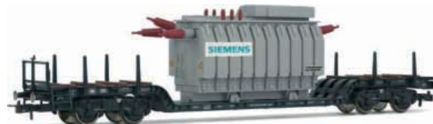
Abbildung zeigt Fotomontage

Tiefadewagen, Bauart Uaik 721 der DB, beladen mit SIEMENS-Transformator