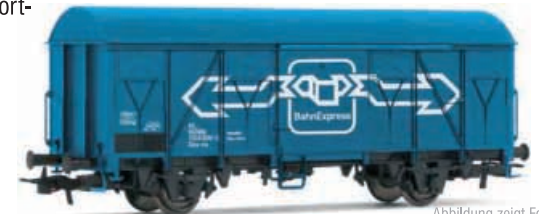
Abbildung zeigt Fotomontage

Gedeckter Güterwagen, Bauart Gs der ÖBB, Ausführung als Fahrradtransportwagen