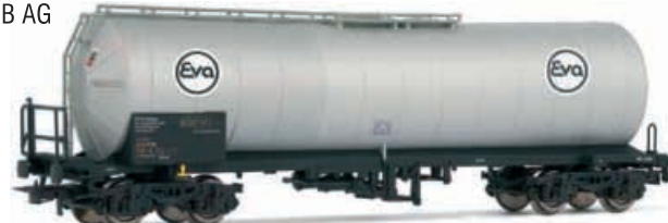
Abbildung zeigt Fotomontage

4-achsiger Kesselwagen, Bauart Zacens der Eva, eingestellt bei der DB AG