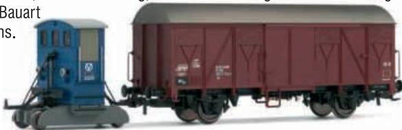
Abbildung zeigt Fotomontage

Breuer-Rangiertraktor der Firma „VÖEST“ (Österreich), beide Achsen angetrieben, Stirnbeleuchtung, im Set mit einem gedeckten Güterwagen der Bauart Gmhs.