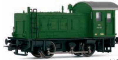
Abbildung zeigt Fotomontage

Diesellokomotive, Reihe 2061 der ÖBB in tannengrüner Lackierung