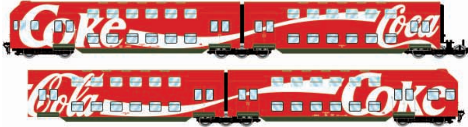
Abbildung zeigt Fotomontage

4-teiliger Doppelstock-Nahverkehrszug der DB AG, Ausführung „Coca-Cola“, mit Steuerwagen