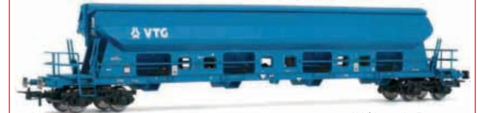
Abbildung zeigt Fotomontage

4-achsiger Schwenkdachwagen, Bauart Tadgs der VTG, eingestellt bei der DB AG