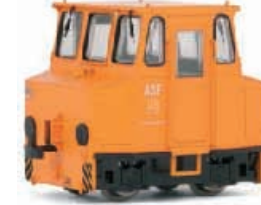
Abbildung zeigt Fotomontage

Akkuschleppfahrzeug in oranger Lackierung der DR