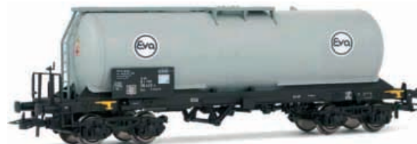
Abbildung zeigt Fotomontage

4-achsiger Kesselwagen, Bauart Zacs der Eva, eingestellt bei der DB AG