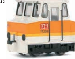
Abbildung zeigt Fotomontage

Akkuschleppfahrzeug 17230 in orange-weißer Lackierung, im Bestand der DB AG