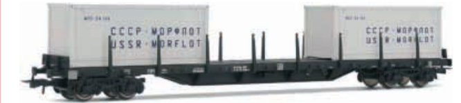
Abbildung zeigt Fotomontage

4-achsiger Rungenwagen, Bauart Rs der DR, beladen mit 2 Containern „MORFLOT“