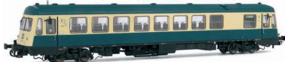
Abbildung zeigt Fotomontage

Dieseltriebwagen, Baureihe 627.0 der DB, in ozeanblau-beiger Lackierung, mit Puffern und Standard-Kupplungen, mit ab Werk eingebauter Innenbeleuchtung, Betriebsnummer 627 002-9, Bw Kempten