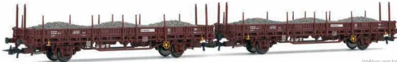
Abbildung zeigt Fotomontage

2-teiliges Set Rungenwagen, Bauart Kbs der DR, beladen mit Schotter