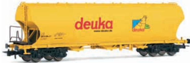
Abbildung zeigt Fotomontage

Silowagen, Bauart Uapps „deuka“, eingestellt bei der DB