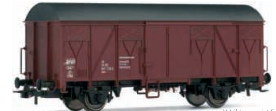
Abbildung zeigt Fotomontage

Gedeckter Güterwagen, Bauart Gs der DR, Ausführung als Materialkurswagen