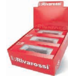
Abbildung zeigt Fotomontage