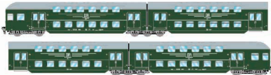
Abbildung zeigt Fotomontage

4-teiliger Doppelstock-Nahverkehrszug der DR, dunkelgrüne Ausführung der Epoche IV