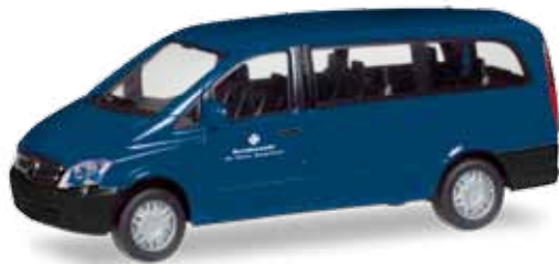
746267 Mercedes-Benz Vito Bus „Bundeswehr“