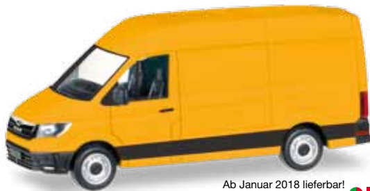
Ab Januar 2018 lieferbar! Delivery in January 2018! H0 1/87

013314 8,95 € Minikit Mercedes-Benz Sprinter Kasten Flachdach Minikit Mercedes-Benz sprinter box-type flat roof Ideal für Umbauer und Bastler ist der aktuelle Mercedes-Benz Sprinter Kasten mit flachem Dach als Minikit. Die Warnlichtbalken liegen dem Bausatz bei. / The current Mercedes-Benz Sprinter van with flat roof as Minikit is ideal for converters and hobbyists. The warning light bar is enclosed with the kit.