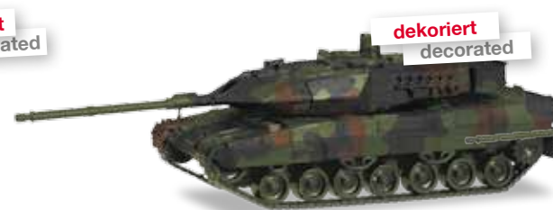
F HO 1/87 29,95 € 24,95 €