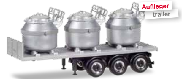
307246 Mercedes-Benz Actros Classicspace 2,3 Aluminiumtiegel-Sattelzug / Mercedes-Benz Actros Classicspace 2,3 aluminum pot semitrailer „Nicomet“ (PL) 013291 Minikit Mercedes-Benz Actros Classicspace 2,3 Zugmaschine, weiß / Minikit Mercedes-Benz Actros Classicspace 2,3 rigid tractor, white 076838 Auflieger mit 3 Aluminiumtiegeln, silber / Trailer with 3 aluminum pots, silver Mit flacher Actros Kabine ist der komplett in silber lackierte Sattelzug des polnischen Unternehmens Nicromet unterwegs. Die drei Behälter sind mit unterschiedlichen Nummern versehen. / The all-silver semitrailer of the Polish company Nicromet is operated with a flat Actros cab. The three containers feature different numbers.