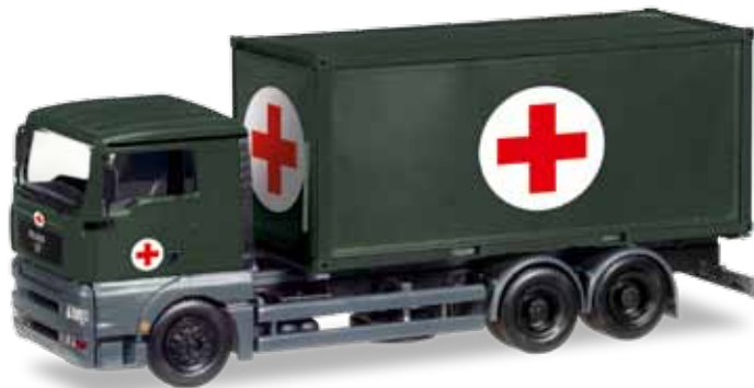
746250 MAN TGA XL Wechselkoffer-LKW mit Sanitätscontainer / MAN TGA XL interchangeable-truck with medical container „Bundeswehr“

JETZT NEU: MILITÄR MINIKITS! NOW NEW: MILITARY MINIKITS!