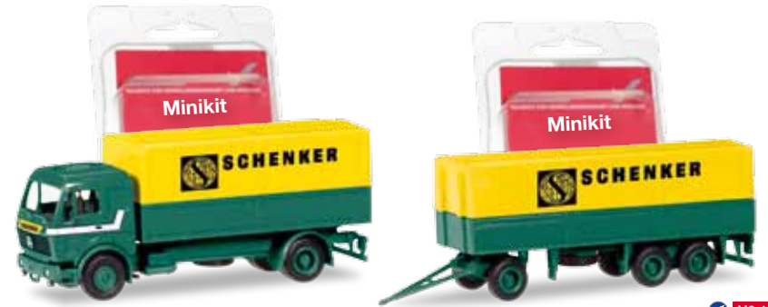
308687 Mercedes-Benz Planen-Hängerzug / Mercedes-Benz canvas cover trailer „Schenker“ 013321 Minikit Mercedes-Benz Planen-LKW / Minikit Mercedes-Benz canvas trailer „Schenker“ 013338 Minikit Planen-Hänger 3-achs / Minikit canvas trailer 3-axle „Schenker“

In der klassischen Farbgebung der 1980er Jahre legt Herpa den Mercedes-Benz Planen-Hängerzug zeitgemäß, ohne seitlichen Unterfahrerschutz einmalig auf. Parallel dazu werden auch LKW und Hänger, jeweils mit dem Schenker-Logo bedruckt, einzeln als Minikit angeboten. Herpa produces the Mercedes-Benz tarpaulin trailer in the classic 1980s design and sans lateral underride guard. Parallel with that, truck and trailer printed with the Schenker logo are available individually as Minikits.