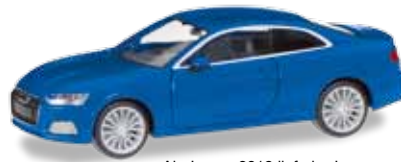
Ab Januar 2018 lieferbar! Delivery in January 2018! H0 1/87

030601-002 14,95 € Porsche 911 Turbo, blaumetallic / blue metallic 013307 5,95 € Minikit Porsche 911 Turbo, weiß / white Der Porsche-Klassiker von Herpa wird erneut das Sortiment der Sportwagen ergänzen, zunächst in Blaumetallic. Zudem erscheint das Modell auch als Minikit für freie Farbgestaltungen. / The Porsche classic once again enhances the sports car range, first off in blue-metallic. Furthermore, the model is released as Minikit for your individual designs.