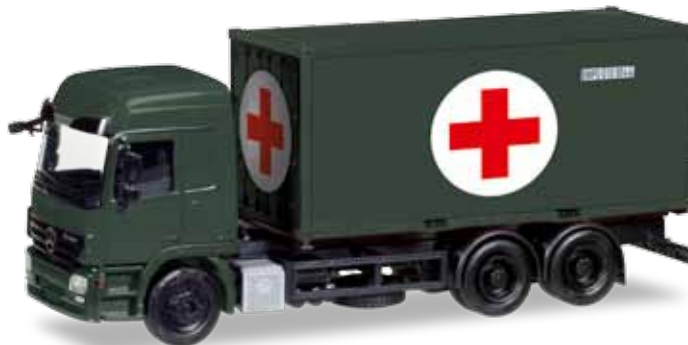
746243 Mercedes-Benz Actros L '08 Wechselkoffer-LKW mit Sanitätscontainer, bronzegrün Mercedes-Benz Actros L '08 interchangeable truck with medical container, bronze green „Bundeswehr“ 013383 Minikit Mercedes-Benz Actros L '08 Wechselkoffer-LKW mit Container, bronzegrün / Mercedes-Benz Actros L '08 interchangeable truck with container, bronze green