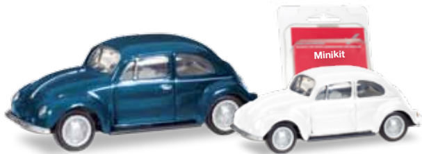
Ab Februar 2018 lieferbar! Delivery in February 2018! H0 1/87

053136-004 12,95 € Simon KR 51/1, minzgrün / mint green