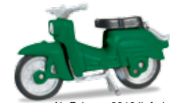
Ab Februar 2018 lieferbar! Delivery in February 2018! H0 1/87

024556-005 7,95 € Opel Kapitän, weinrot / weiß / wine red / white