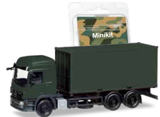
HO 1/87 26,95 € 18,95 €