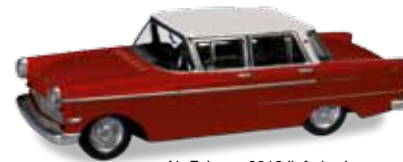
Ab Februar 2018 lieferbar! Delivery in February 2018! H0 1/87

038669-002 14,95 € Audi A5 Coupé, scubablau metallic / scubablue metallic