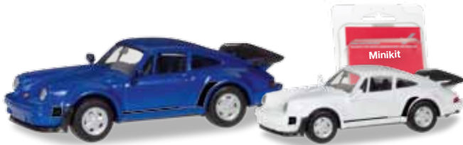
Ab März 2018 lieferbar! Delivery in March 2018! H0 1/87

030601-002 14,95 € Porsche 911 Turbo, blaumetallic / blue metallic 013307 5,95 € Minikit Porsche 911 Turbo, weiß / white Der Porsche-Klassiker von Herpa wird erneut das Sortiment der Sportwagen ergänzen, zunächst in Blaumetallic. Zudem erscheint das Modell auch als Minikit für freie Farbgestaltungen. / The Porsche classic once again enhances the sports car range, first off in blue-metallic. Furthermore, the model is released as Minikit for your individual designs.