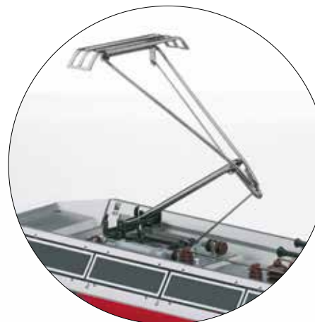
Motorisch heb- und senkbare Stromabnehmer