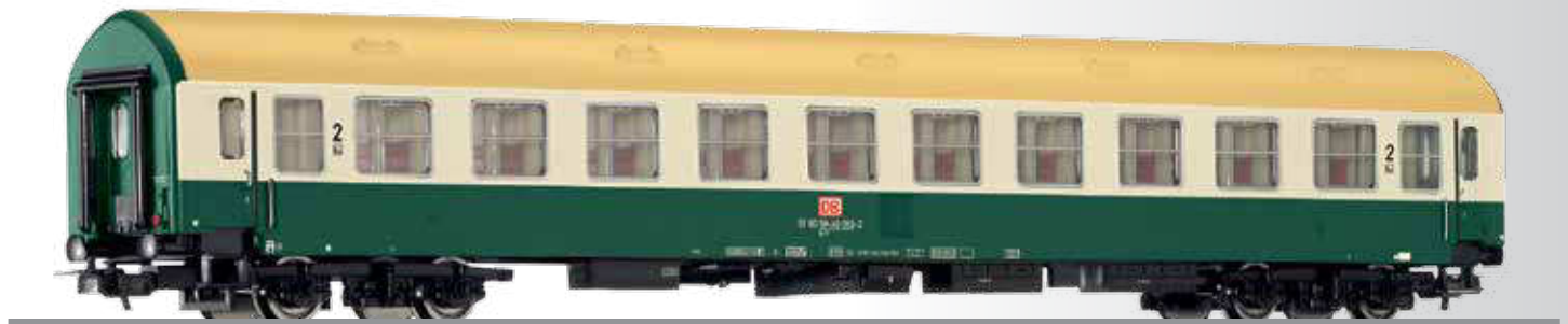
Reisezugwagenset der DB AG, bestehend aus drei Reisezugwagen, Typ Y/B 70 Passenger coach set of the DB AG with three passenger coaches, type Y/B 70