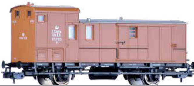
Abbildung zeigt 70011

Güterzugpackwagen der K.Sächs.Sts.EB Baggage car of the K.Sächs.Sts.EB