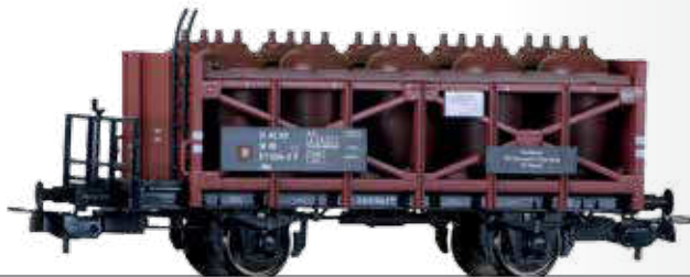
Säuretopfwagen Uhk „VEB Synthesewerk Schwarzheide“ der DR Acid pot car Uhk “VEB Synthesewerk Schwarzheide” of the DR