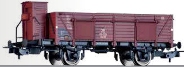
Offener Güterwagen Om 93 der DB Open car Om 93 of the DB