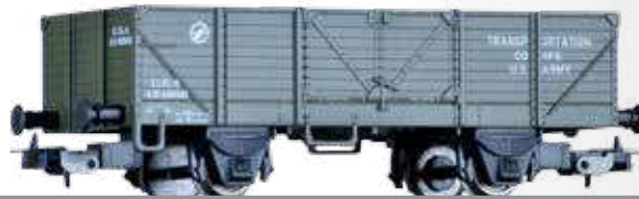
Offener Güterwagen der USTC Open car of the USTC