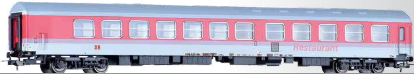
Speisewagen WRm, Bauart Halberstadt, der DR Dining coach WRm, type Halberstadt, of the DR