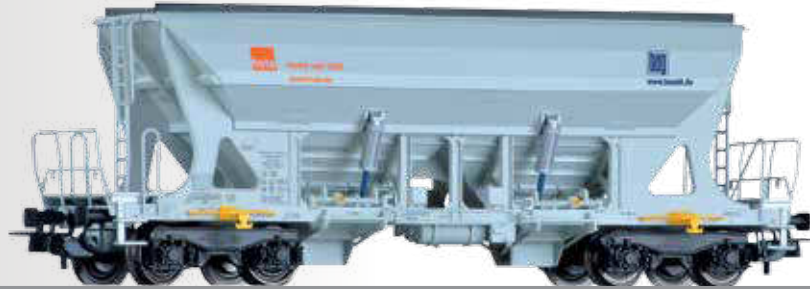
Selbstentladewagen Faccons der hvle / Basalt AG Hopper car Faccons of the hvle / Basalt AG