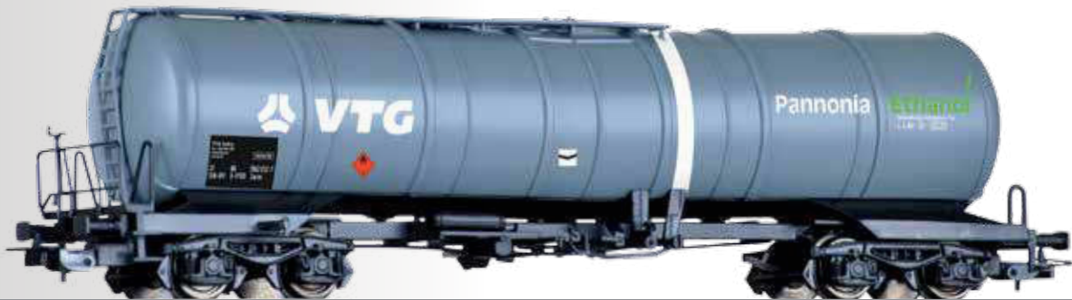
Kesselwagen Zacns der VTG / Pannonia Ethanol Tank car Zacns of the VTG / Pannonia Ethanol