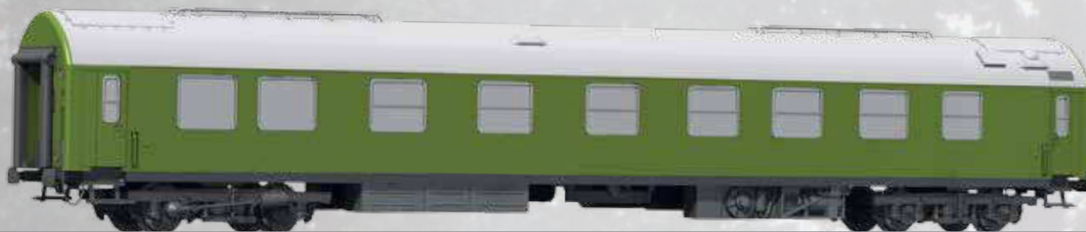
Salonwagen B mit Küche, ursprüngliche Nummer 60 50 89-40 009-3