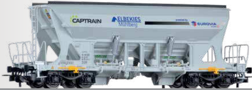
Selbstentladewagen Faccons der CAPTRAIN / EUROVIA Hopper car Faccons of the CAPTRAIN / EUROVIA