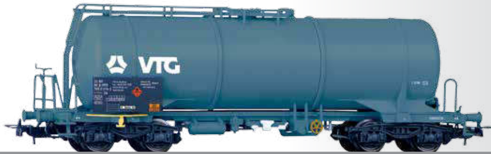
Kesselwagen Zas der VTG Tank car Zas of the VTG