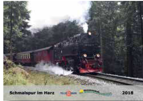
Schmalspur-Kalender 2018 Narrow-gauge calendar 2018