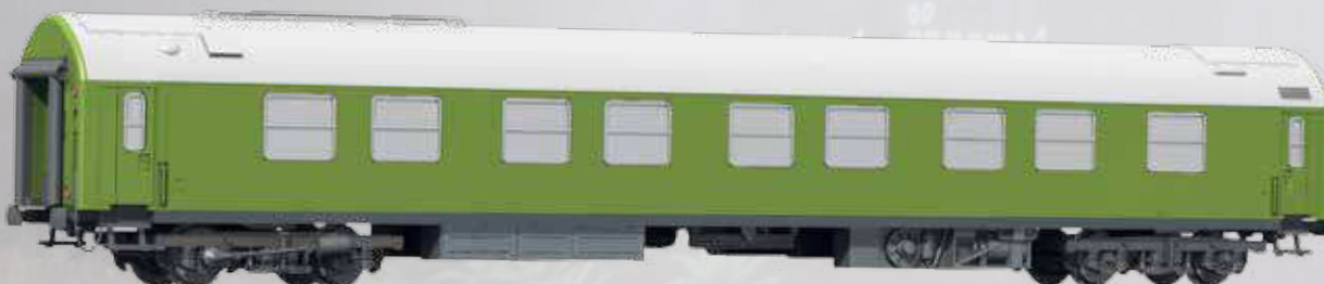
Beiwagen zum Salonwagen B, ursprüngliche Nummer 60 50 70-80 109-2