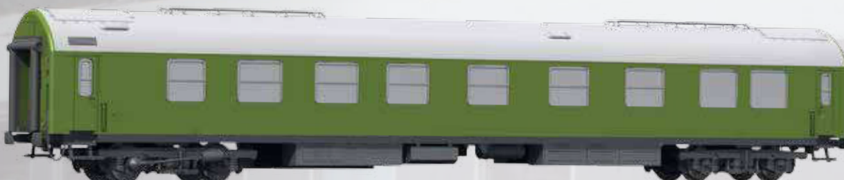
Salonwagen B ohne Küche , ursprüngliche Nummer 60 50 89-40 011-9