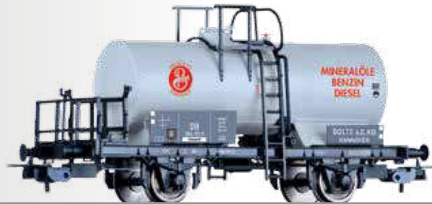
Kesselwagen „Bolte & Co. KG“ der DB Tank car „Bolte & Co. KG“ of the DB