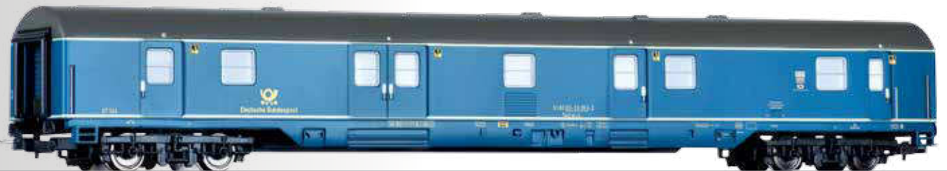
ÜBERARBEITUNG: Bahnpostwagen Post mr-a/26 der Deutschen Bundespost NEW: Mail wagon Post mr-a/26 of the Deutschen Bundespost