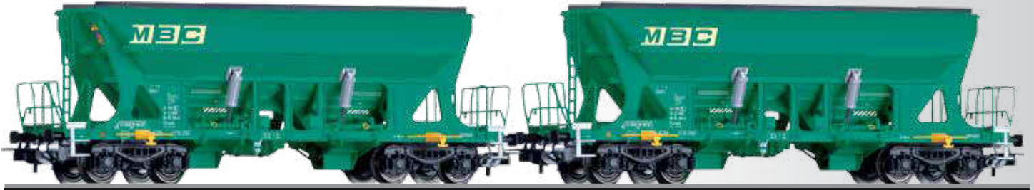
Güterwagenset der MBC, bestehend aus zwei Selbstentladewagen Faccns Freight car set of the MBC with two hopper cars Faccns