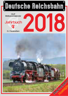
DR-Kalender 2018 DR calendar 2018 (Feuerlöcher Verlag)