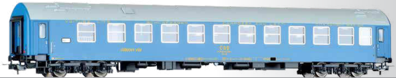
Schlafwagen WLAB, Typ Y, der ČSD Sleeping coach WLAB, type Y, of the ČSD