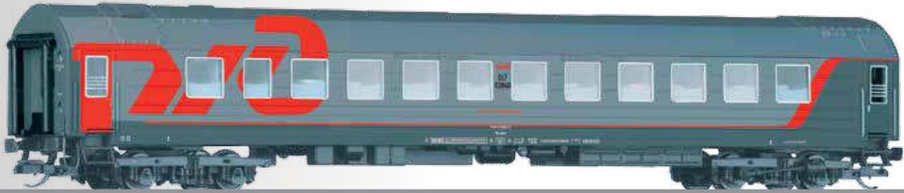
Abbildung zeigt TT-Modell