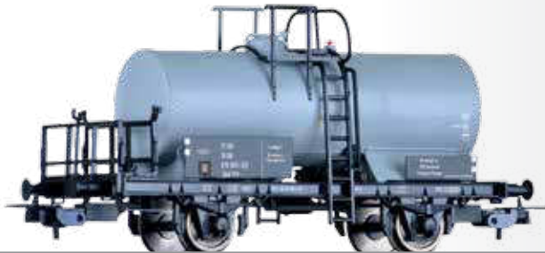
Kesselwagen Uhk „VEB Kombinat Schwarze Pumpe“ der DR Tank car Uhk “VEB Kombinat Schwarze Pumpe” of the DR