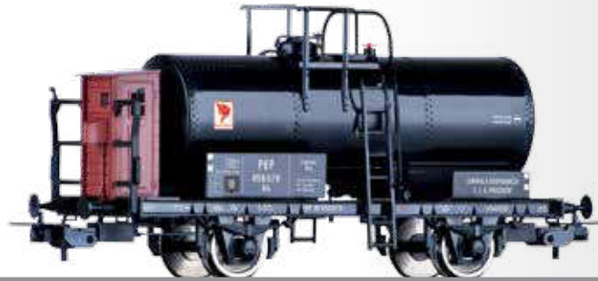
Kesselwagen Rh der PKP Tank car Rh of the PKP