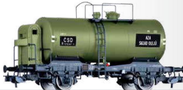
Kesselwagen R „SKLAD OLEJU“ Tank car R „SKLAD OLEJU“