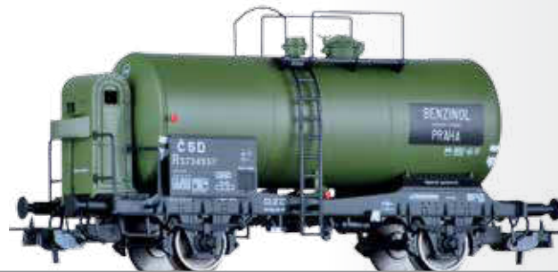
Kesselwagen R „BENZINOL“ der ČSD Tank car R „BENZINOL“ of the ČSD