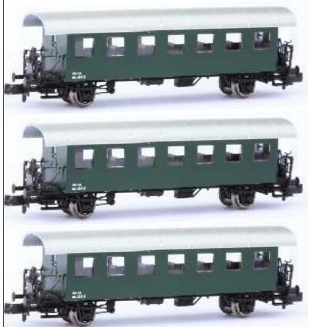
60406 SPUR N

Ep III/IV, Set mit 3 zweiachsigen Personenwagen Bauart Bi. Unterschiedliche Beschriftungen, Ausführung mit Ganzfenstern und einem Packwagen Bauart BDiho.