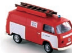
LC3880 VW Bus T2, 2er Set Kastenwagen „Feuerwehr“ UVP 19,95 €