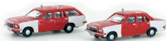
LC4510 Opel Rekord D, 2er Set Karavan und Coupé, Feuerwehr UVP 21,49 €