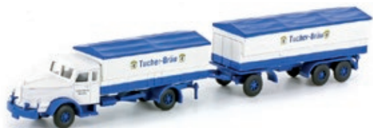
LC3314 Krupp Titan Hängerzug, „Tucher Bräu“ UVP 25,95 €