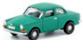
LC4102 VW 1600 L T3 Stufenheck, ulmengrün UVP 11,99 €