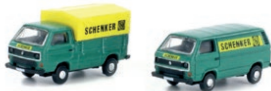
LC4316 VW T3, 2er Set SCHENKER UVP 22,99 €