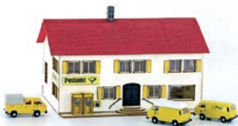
LC5028 Lasercut Bausatz Postgebäude mit 3er Set MINIS VW T3 Post, UVP 54,90 €