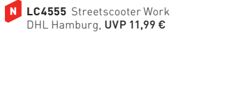
N LC4555 StreetScooter Work DHL Hamburg, UVP 11,99 €