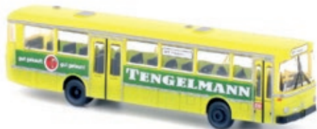
LC4023 Mercedes-Benz O 307, DB „Tengelmann“ gelb UVP 21,95 €