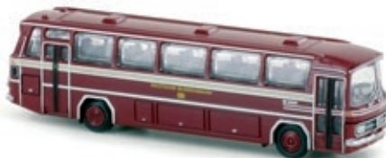
LC4412 Mercedes-Benz O 321, „DB“ UVP 21,99 €