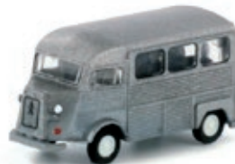
LC4155 Citroën Typ HY, Bus silber UVP 12,95 €