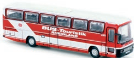
LC4421 Mercedes-Benz O 303, „DB Bus-Touristik“ UVP 21,99 €

Der O 303 war eine Weiterentwicklung des Vorgängers MB O 302. Der O 303 war vor allem als Reisebus konzipiert, doch es gab auch weiterhin Linienbusse, sowie verschiedene Reisebusse in unterschiedlicher Ausstattung bis hin zum Fernreisebus.