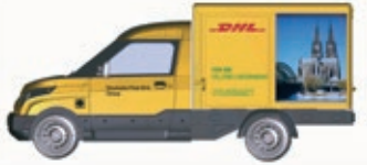
HO LC5202 Streetscooter Work DHL Köln, UVP 18,99 €