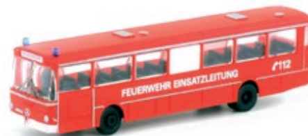
LC4024 Mercedes-Benz O 307, „Feuerwehr“ UVP 21,95 €