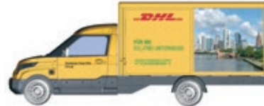
HO LC5206 Streetscooter Work-L DHL Frankfurt, UVP 18,99 €