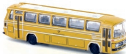
LC4411 Mercedes-Benz O 302, „Deutsche BP“ UVP 21,99 €

Der MB O 302 war ein Universalbus und in vielen Konfigurationen erhältlich. Als Linienbus, Überlandwagen oder Reisebus. Der O 302 löst bei seiner Präsentation im Jahr 1965 den beliebten O 321 H ab. Der O 302 blieb zehn Jahre im Programm, bis er 1974 durch den Typ O 303 ersetzt wurde. Zur Fußball-Weltmeisterschaft 1974 in der Bundesrepublik Deutschland stellte Daimler-Benz jeder Nationalmannschaft einen Reisebus O 302 mit entsprechend den jeweiligen Landesfarben lackierten Außenseiten zur Verfügung.