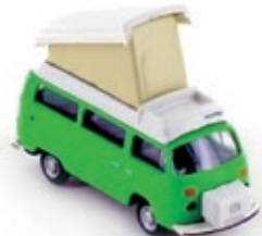
LC3883 VW Bus T2 Camper grün UVP 11,99 €