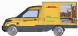
N LC4554 StreetScooter Work DHL Stuttgart, UVP 11,99 €