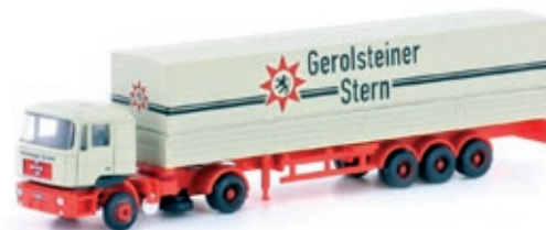
LC4060 MAN F90 Sattelzug, „Gerolsteiner Wasser“ UVP 27,95 €