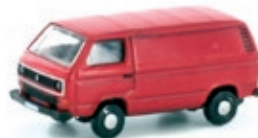
LC4301 VW T3 orientrot UVP 9,99 €

Wie alle VW-Busse trug auch die dritte Generation die Typbezeichnung Typ 2. Innerhalb dieser Baureihe wurden die einzelnen Modelle T1, T2 und T3 intern durchnummeriert. Dabei handelt es sich aber um eine inoffizielle Bezeichnung, obwohl sich letztlich T3 für diese Modellreihe durchgesetzt hat. Offiziell hieß die Reihe T2-Modell '80.