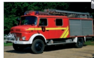
LC4204 LF 16 Ts Freiwillige Feuerwehr Lotte/Os. UVP 29,99 €