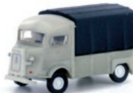
LC4161 Citroën Typ HY, Pritsche / Plane UVP 12,95 €