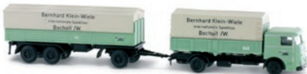
LC3618 LU 11 Commodore Hängerzug „Klein-Wiele Spedition“ UVP 24,95 €