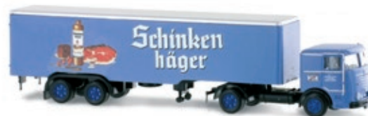
LC3622 LU 11 Commodore Hängerzug „Schinkenhäger“ UVP 25,95 €