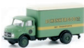
LC3458 MB L322 Kofferaufbau „Schenker“ UVP 13,95 €