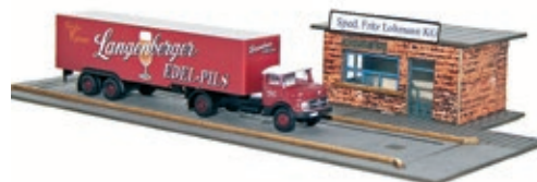
LC5030 LKW Waage mit 1 x MINIS MB L322, UVP 36,90 €