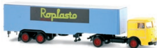
LC3621 LU 11 Commodore Hängerzug „Roplasto“ UVP 25,95 €