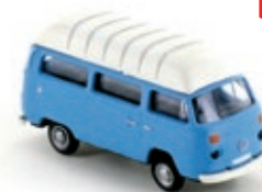
LC3886 VW Bus T2 Kastenwagen mit Hochdach, blau UVP 9,95 €