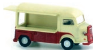
LC4152 Citroën Typ HY, Verkaufstheke UVP 13,95 €