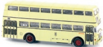
LC4403 Büssing 2DU, creme UVP 21,99 €