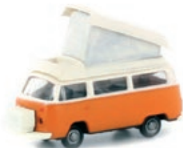
LC3881 VW Bus T2 Camper orange/weiß UVP 11,99 €