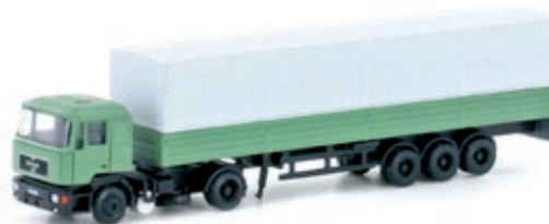
LC4062 MAN F90 Sattelzug, Pritsche / Plane grün UVP 27,95 €