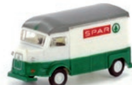
LC4154 Citroën Typ HY, SPAR UVP 13,95 €