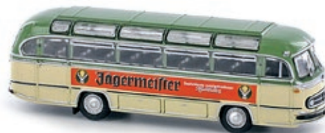
LC4434 Mercedes-Benz O 321, „Jägermeister“ UVP 21,99 €