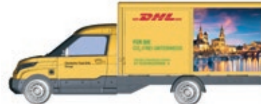
HO LC5208 Streetscooter Work-L DHL Dresden, UVP 18,99 €