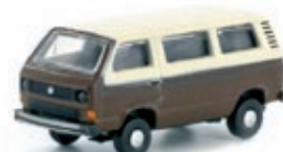
LC4321 VW T3 blau UVP 9,99 €