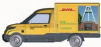
N LC4552 StreetScooter Work DHL Köln, UVP 11,99 €