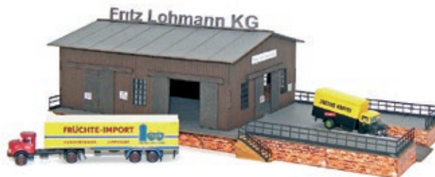
LC5029 Speditionsgebäude mit 2 x MINIS MB L322, UVP 57,90 €