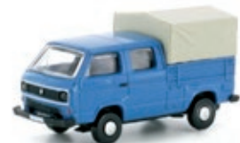
LC4320 VW T3 DoKa blau UVP 10,99 €