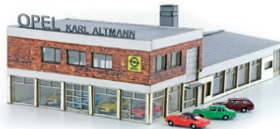
LC5031 OPEL Autohaus mit 4 x MINIS Opel Rekord, UVP 53,90 €