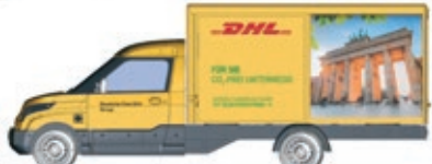
HO Exklusiv für Post Philatelie Streetscooter Work-L DHL Berlin