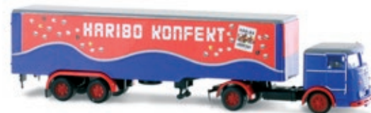
LC3624 LU 11 Commodore Hängerzug „HARIBO Konfekt“ UVP 26,95 €