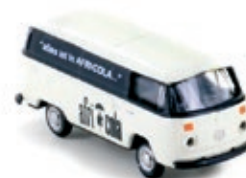
LC3878 VW Bus T2, 2er Set Kastenwagen „AFRI / Bluna“ UVP 19,95 €