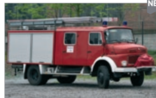
LC4201 LF 16 Ts neutral rot UVP 29,99 €