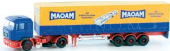
LC4059 MAN F90 Sattelzug, „MAOAM“ UVP 27,95 €