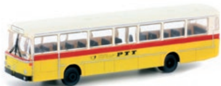
LC4020 Mercedes-Benz O 307, „PTT CH“ UVP 21,95 €