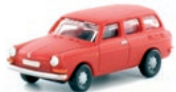
LC4107 VW 1600 L Variant Kombi, iberischrot UVP 11,99 €