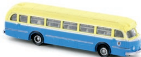
LC3519 Mercedes-Benz O 6600 H, „München“ UVP 21,95 €