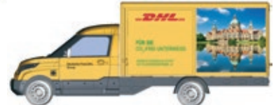
HO LC5207 Streetscooter Work-L DHL Hannover, UVP 18,99 €