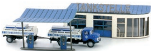
LC5026 Lasercut Bausatz Tankstelle mit MINIS MB L322 Hängerzug, UVP 39,90 €