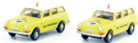
LC4115 VW 1600 L Variant Kombi, 2er Set „ADAC“ UVP 23,99 €