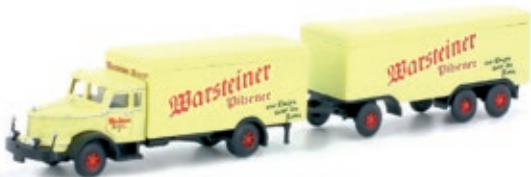
LC3317 Krupp Titan Hängerzug, „Warsteiner“ UVP 25,95 €