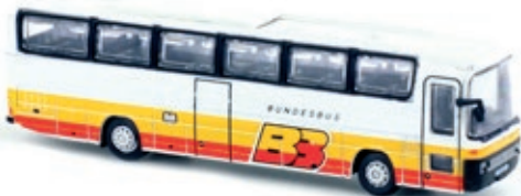
LC4423 Mercedes-Benz O 303, „Bundes Bus Österreich“ UVP 21,99 €