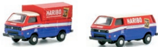
LC4323 VW T3, 2er Set HARIBO UVP 24,99 €