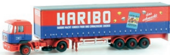
LC4058 MAN F90 Sattelzug, „HARIBO“ UVP 27,95 €