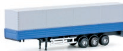
LC4063 MAN F90 Sattelaufleger, Plane blau UVP 14,95 €