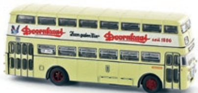
LC4401 Büssing 2DU, „Dornkaat“ UVP 21,99 €