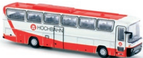
LC4422 Mercedes-Benz O 303, „Hamburger Hochbahn“ UVP 21,99 €