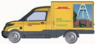
HO LC5203 Streetscooter Work DHL Ruhrgebiet, UVP 18,99 €