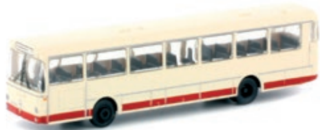
LC4019 Mercedes-Benz O 307, neutral beige UVP 21,95 €