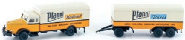
LC3315 Krupp Titan Hängerzug, „Pfanni“ UVP 25,95 €