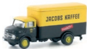
LC3454 MB L322 Kofferaufbau „Jacobs Kaffee“ UVP 13,95 €

Der klassische auf den Rahmen aufgesetzte Kühler zierte die Mercedes Benz LKW seit Anfang des 20. Jh. Es war also eine kleine Revolution als 1958 die komplett neugestylte Kurzhauben-Baureihe die Fachwelt überrascht. Ein breiter Kühlergrill im Stil der SL Personenwagen und eine über die ganze Breite gezogene Haube kennzeichnen den neuen 6-Tonner L 322 mit 110 PS.