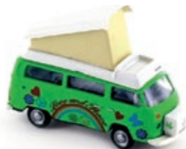
LC3884 VW Bus T2 Camper „Flower“ UVP 11,99 €