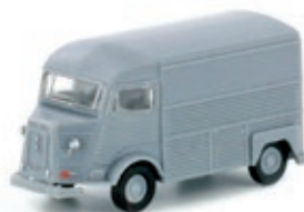
LC4150 Citroën Typ HY, Kasten silber UVP 12,95 €