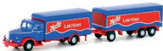
LC3316 Krupp Titan Hängerzug, „HARIBO“ UVP 25,95 €