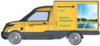
HO LC5201 Streetscooter Work Deutsche Post, UVP 18,99 €