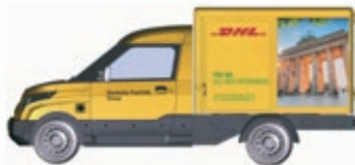
N LC4556 StreetScooter Work DHL Berlin, UVP 11,99 €