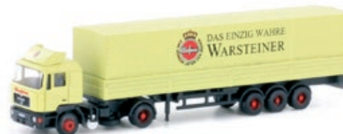
LC4061 MAN F90 Sattelzug, „Warsteiner“ UVP 27,95 €