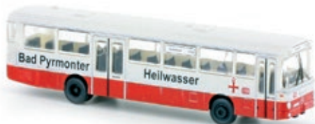
LC4021 Mercedes-Benz O 307, DB „Bad Pyrmonter Heilwasser“ UVP 21,95 €