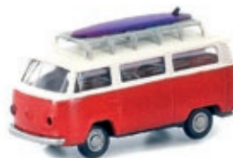
LC3887 VW Bus T2, 2er Set Gepäckträger „Surf / Kanu“ UVP 21,95 €