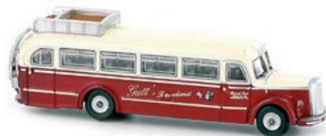
LC4442 Mercedes-Benz O 6600, „Gutts Reisen“ UVP 21,99 €