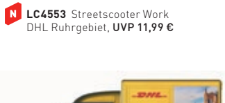
N LC4553 StreetScooter Work DHL Ruhrgebiet, UVP 11,99 €