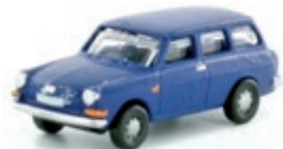
LC4106 VW 1600 L Variant Kombi, saphirblau UVP 11,99 €