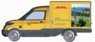
HO LC5204 Streetscooter Work DHL Stuttgart, UVP 18,99 €