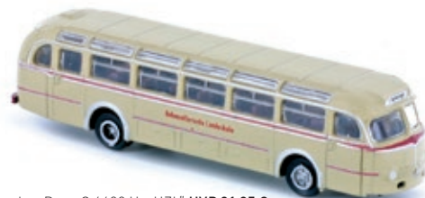
LC3518 Mercedes-Benz O 6600 H, „HZL“ UVP 21,95 €