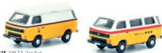
LC4315 VW T3, 2er Set PTT Schweiz UVP 22,99 €