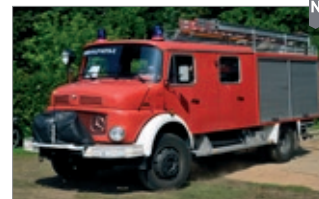
LC4202 LF 16 Ts Düsseldorf UVP 29,99 €