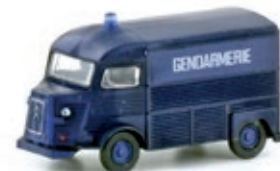
LC4172-1 Citroën Typ HY, Gendarmarie dunkel-blau UVP 13,95 €