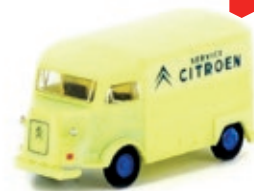
LC4151 Citroën Typ HY, Kasten Citroën Service UVP 13,95 €