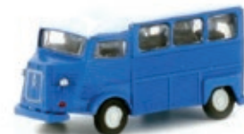
LC4156 Citroën Typ HY, Bus blau UVP 12,95 €