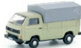
LC4319 VW T3 Pritsche / Plane grau UVP 10,99 €