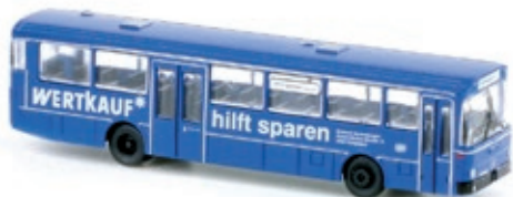
LC4022 Mercedes-Benz O 307, DB „Wertkauf“ UVP 21,95 €