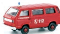
LC4309 VW T3, 2er Set FEUERWEHR UVP 22,99 €