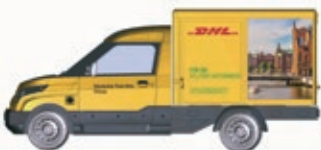
HO LC5205 Streetscooter Work DHL Hamburg, UVP 18,99 €