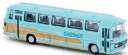
LC4413 Mercedes-Benz O 321, „Deutsche Touring Eurobus“ UVP 21,99 €