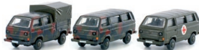
LC4312 VW T3, 3er Set BUNDESWEHR UVP 31,99 €