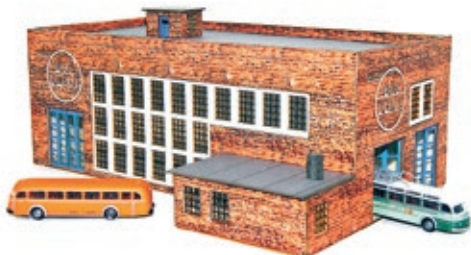
LC5027 Lasercut Bausatz Busdepot mit 2 x MINIS MB O6600, UVP 59,90 €