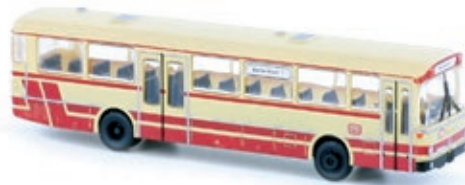
LC4018 Mercedes-Benz O 307, „DB“ creme / rot UVP 21,95 €