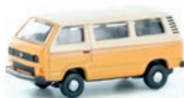
LC4304 VW T3 orange / weiß UVP 9,99 €