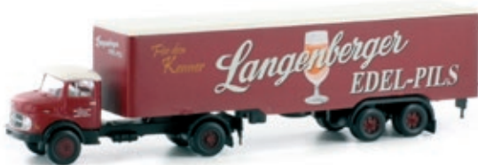
LC3464 MB L322 Hängerzug, „Langenberg Pils“ UVP 19,95 €