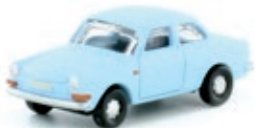
LC4101 VW 1600 L T3 Stufenheck, marinablau UVP 11,99 €

Der Typ 3 war der erste Mittelklassewagen von Volkswagen, gefertigt mit zwei verschiedenen Limousinenkarosserien und als Kombi; er wurde 1961 auf der Internationalen Automobilausstellung in Frankfurt als VW 1500 vorgestellt. Von dem nur zweitürig angebotenen Modell wurden bis Mitte 1973 fast 2,6 Millionen Wagen hergestellt.