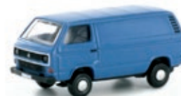
LC4317 VW T3 blau UVP 9,99 €