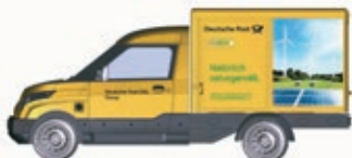
N LC4551 StreetScooter Work Deutsche Post, UVP 11,99 €