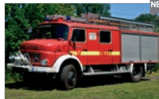
LC4203 LF 16 Ts 112 Freiwillige Feuerwehr UVP 29,99 €