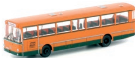
LC4017 Mercedes-Benz O 307, „RVO / München“ UVP 21,95 €

Der O 307 war angelehnt an den O 305 Stadtbus, unterschied sich aber durch die größeren, seitlich herumgezogenen Frontscheiben, die sogenannte „StÜLB-Front“ sowie Außenschwenktüren.