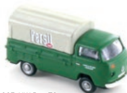
LC3885 VW Bus T2 Pritsche „Persil“ UVP 9,95 €

Im Spätsommer 1967 präsentierte das VW-Werk den Nachfolger der ersten VW Bully-Generation als T2. Der T2 war eine komplette Neukonstruktion, basierend auf den Erfahrungen, die man mit dem T1-Modell gemacht hatte mit zahlreichen Karosserieversionen und Aufbauvarianten.