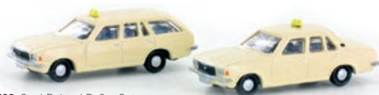
LC4509 Opel Rekord D, 2er Set Karavan und Coupé, TAXI UVP 21,49 €