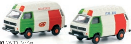
LC4307 VW T3, 2er Set Eis- und Pizza Wagen UVP 22,99 €