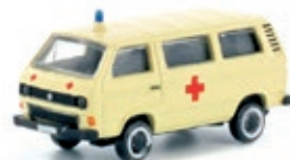
LC4310 VW T3, 2er Set Krankenwagen DRK UVP 22,99 €