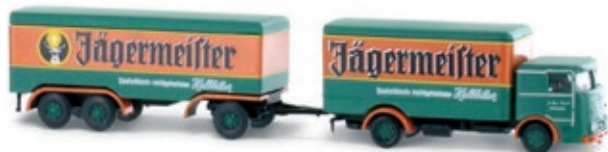
LC3617 LU 11 Commodore Hängerzug „Jägermeister“ UVP 25,95 €