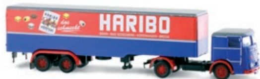
LC3623 LU 11 Commodore Hängerzug „HARIBO“ UVP 26,95 €