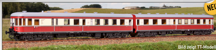
Bild zeigt TT-Modell