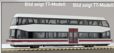
Bild zeigt TT-Modell