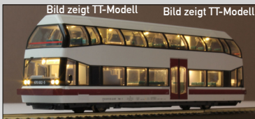
Bild zeigt TT-Modell